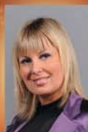
PODSTICAJNI PROGRAM PROFITOM HAJNALKA ŠENK SOARING MENADŽER