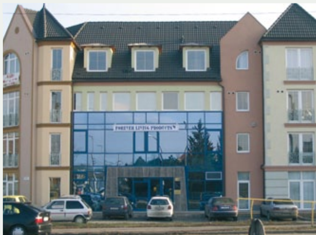
Kancelarija u Debrecinu