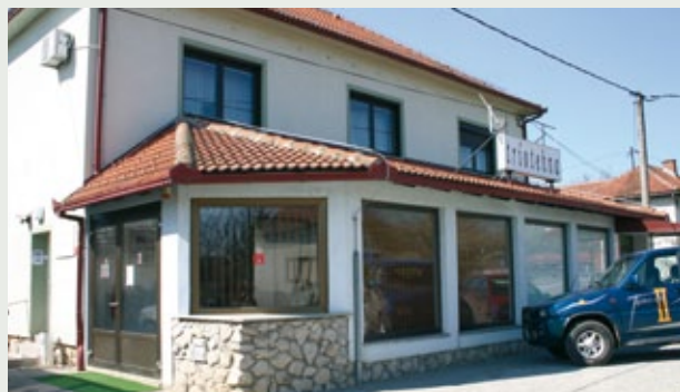
Kancelarija u Lendavi