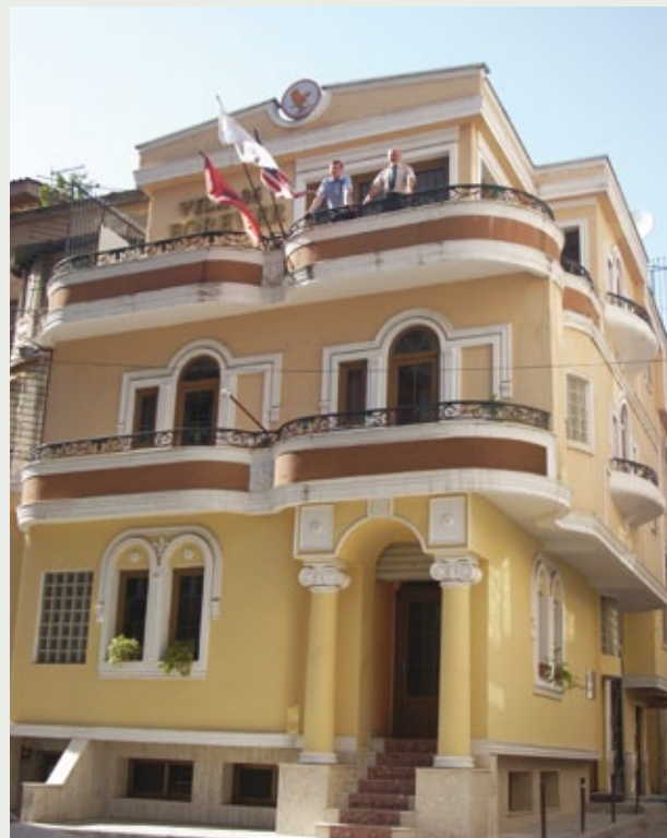
Kancelarija u Albaniji