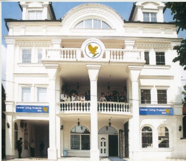
Kancelarija u Bijeljini