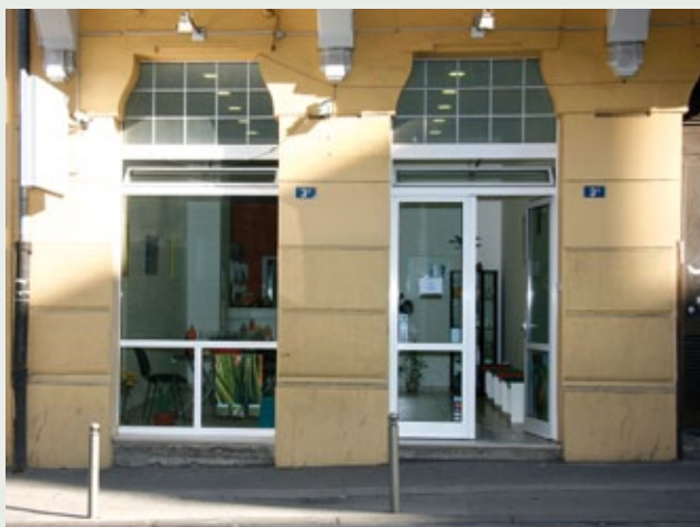
Kancelarija u Rijeci