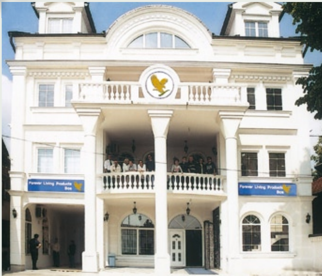
Kancelarija u Bijeljini