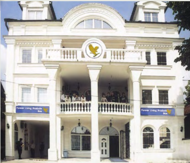
Kancelarija u Bijeljini