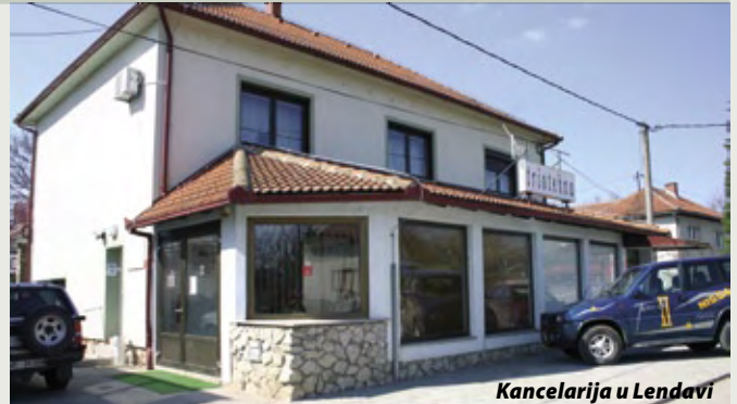
Kancelarija u Lendavi