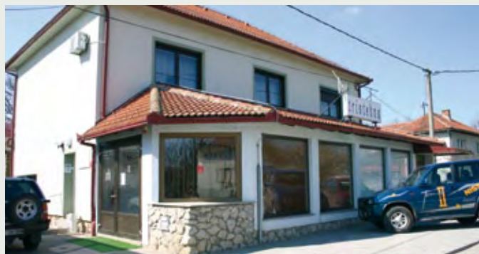
Kancelarija u Lendavi