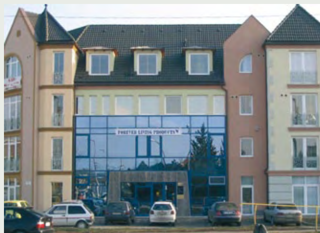
Kancelarija u Debrecinu

Naši partneri koji imaju mađarsko državljanstvo, deo bonusa koji im sledi na osnovu lične kupovine mogu iskoristiti i u vidu povlastice. Na njihovu molbu ćemo za povlasticu smanjiti račune njihove kupovine i tako će platiti račun koji će biti manji za iznos povlastice.