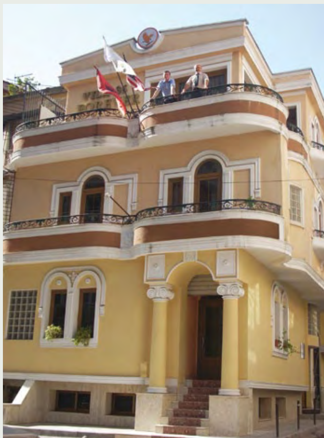
Kancelarija u Albaniji