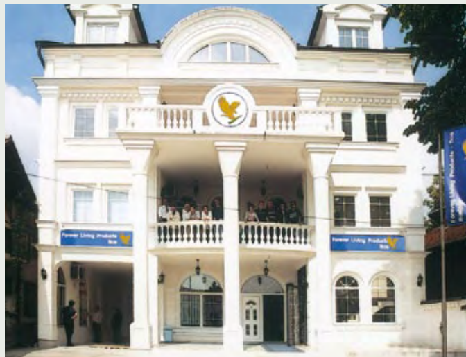
Kancelarija u Bijeljini