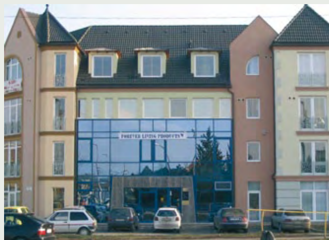
Kancelarija u Debrecinu

Naši partneri koji imaju mađarsko državljanstvo, deo bonusa koji im sledi na osnovu lične kupovine mogu iskoristiti i u vidu povlastice. Na njihovu molbu ćemo za povlasticu smanjiti račune njihove kupovine i tako će platiti račun koji će biti manji za iznos povlastice.