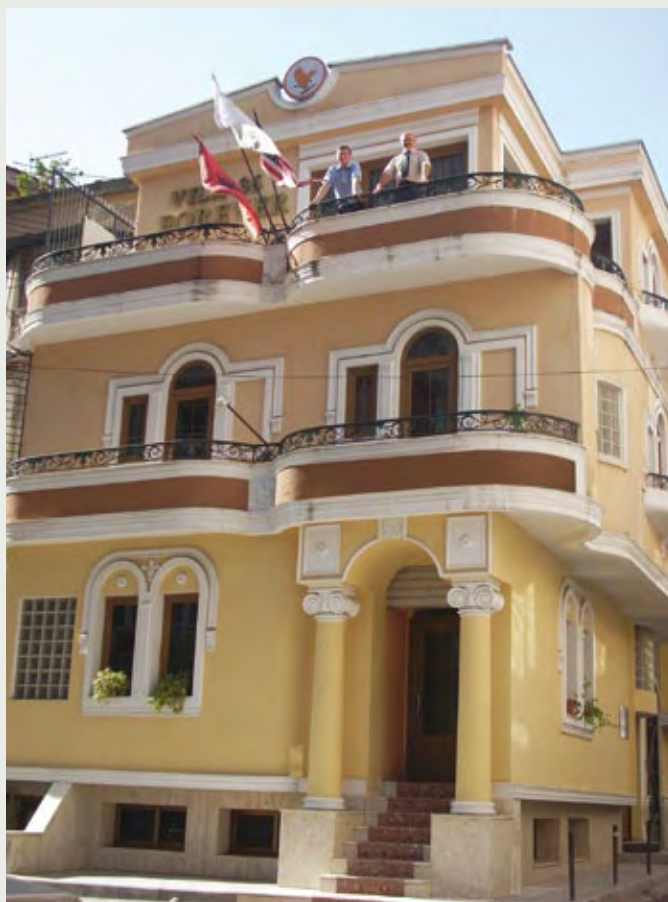
Kancelarija u Albaniji