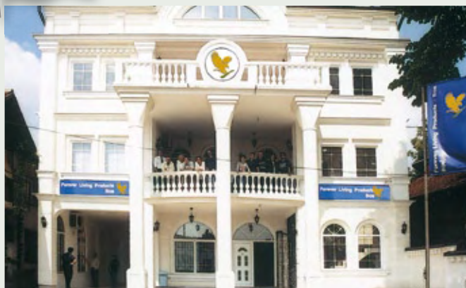
Kancelarija u Bijeljini