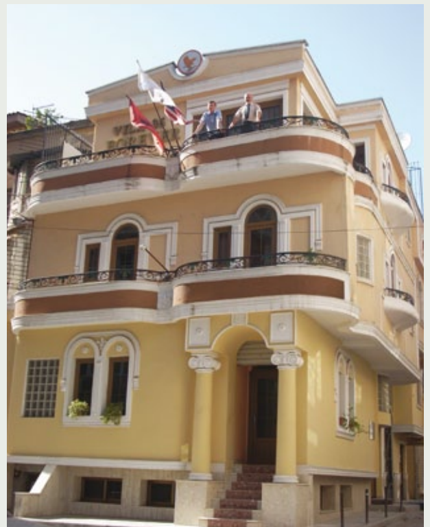
Zyra e Shqipërisë