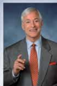
BRIAN TRACY Autor, trainues e konsulent