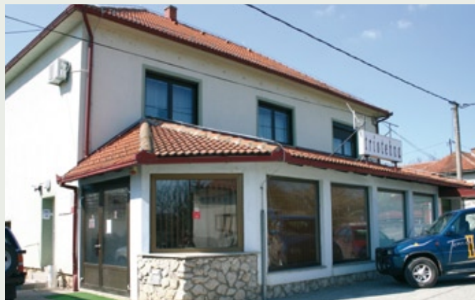
Zyra e Lendvait