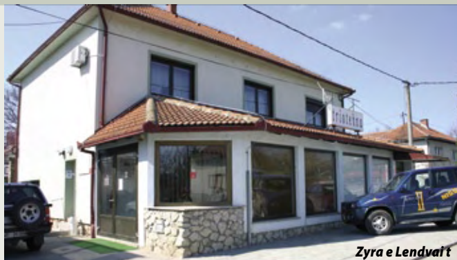
Zyra e Lendavit