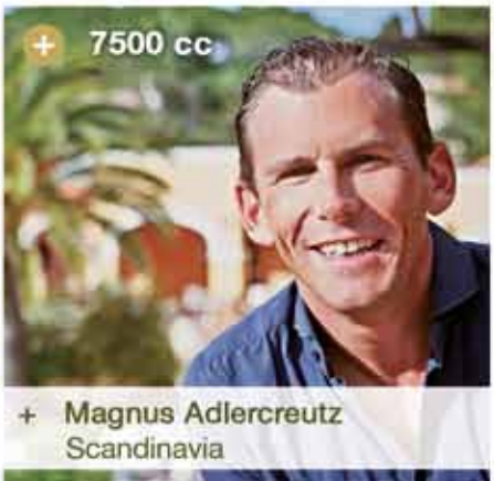
+ Magnus Adlercreutz Scandinavia