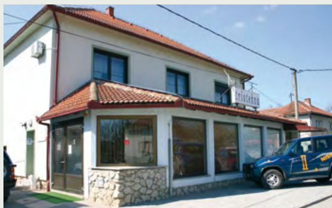
Zyra e Lendvait