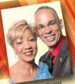
JAN-MARY DHE GEORGETTE JULIEN LUREL Diamant Menaxherë