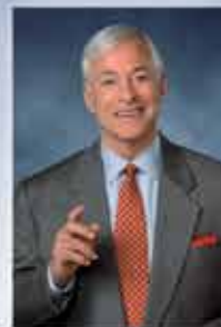
BRIAN TRACY pisatelj, trener in konsultant