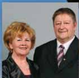
PROGRAM POVEZUJETA: FERENCNÉTANÁCS IN FERENC TANÁCS senior managerja