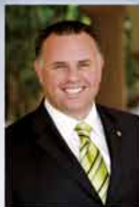
AIDAN O'HARE podpredsednik za Evropo