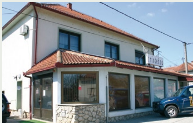
Pisarna v Lendavi