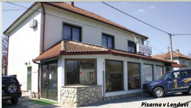
Pisarna v Lendavi