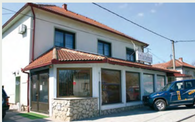
Pisarna v Lendavi