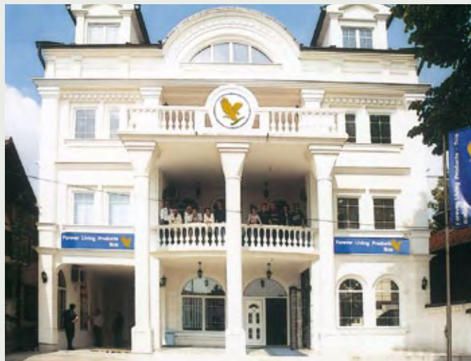
Pisarna v Bijeljini