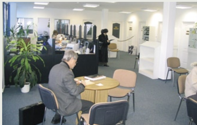
Pisarna v Debrecenu