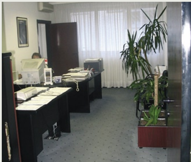
Pisarna v Beogradu

FLP Beograd le v primeru, če vrednost naročila pod eno kodno številko presega vrednost 1 točke. Preko telefona ni možno včlaniti novih članov. Pri telefonskem naročilu upoštevamo le naročila, ki so bila oddana do 25. v mesecu, po tem datumu lahko naročila oddate le osebno v naših pisarnah. Tudi v naših pisarnah v Nišu in Horgošu lahko kupite propagandno gradivo in obrazce za spreminjanje podatkov. Naš naslednji Dan uspeha bo 23. septembra 2006.