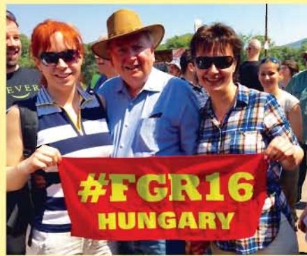
Összes résztvevő: közel 10.000 fő