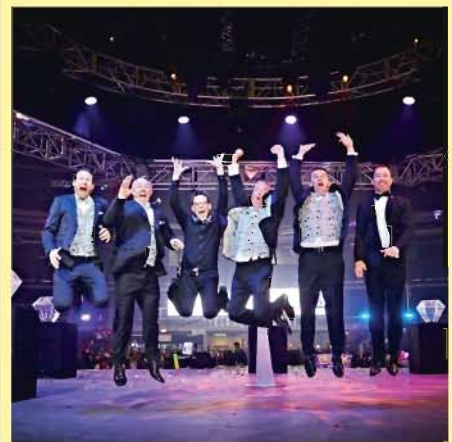
Nr.1.: Egyesült Királyság