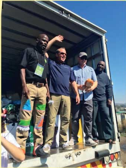
Pack for Phineas – Csomagolj Phineasnak! Az adományokat eljuttattuk a rászoruló, soweto-i gyermekeknek