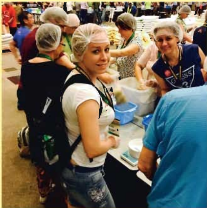
Stop Hunger Now! – Állítsuk meg az éhezést! Közel 400.000 étel-csomag készítése