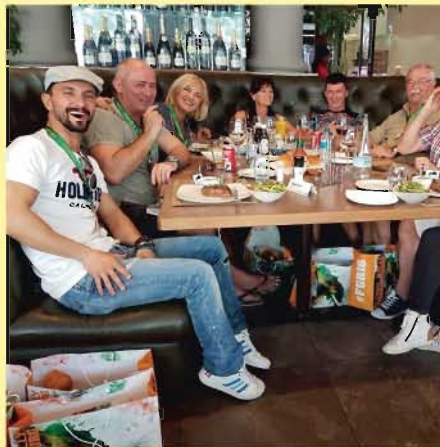
Chairman's Bonus Party Egyszerre 700 csekről hullott le a lepel