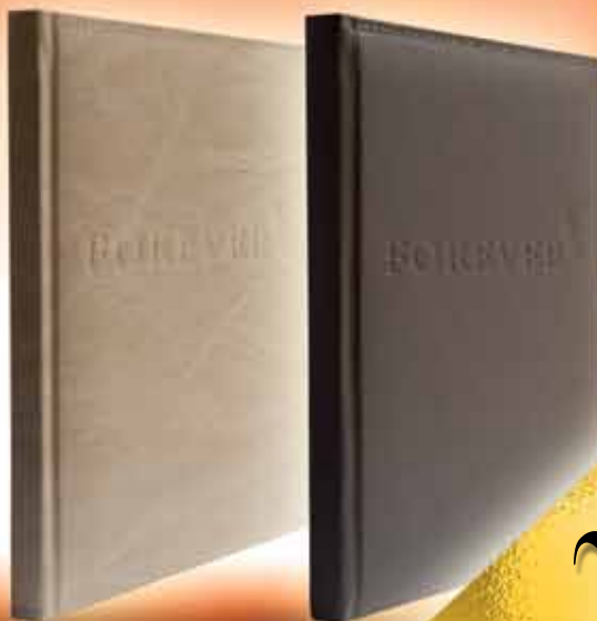
Agenda za leto 2012 S koristnimi informacijami o Forever in o naših izdelkih