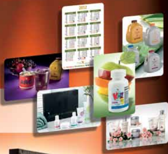
Kartični koledar za leto 2012 10 kosov/paket, 5 različic