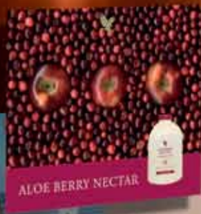
Poster 10 kosov/paket, v papirnatem valju (50x60 cm)