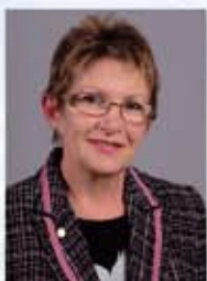
POUČUJEM FOREVER GYŐZŐNÉ MAGYAR MANAGERKA