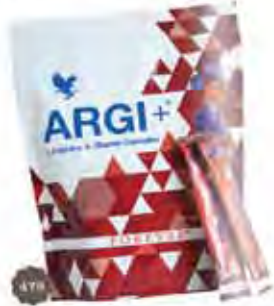
ARGi+ Lippen hidratálás és erősítés. Hőstabilizáló hatású. Széleskörűen alkalmazható. Hosszú ideig tartó hidratáló hatás. Hosszú ideig tartó hidratáló hatás. Hosszú ideig tartó hidratáló hatás.

A jobb közérzettel együtt jár a szebb kinézet is. Akár a barátaid, vagy a családtagjaid közül bárki, aki például sielésre készül, kezdeni, ez egy remek ajándék, hogy egyszerű formában legyenek. Ráadásul a hozd legjobb formád csomaghoz tartozó összes termék megvásárlása esetén megajándékozunk a készlet erejéig.