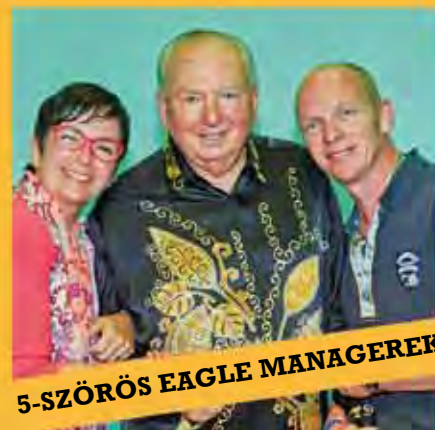
5-SZÖRÖS EAGLE MANAGEREK