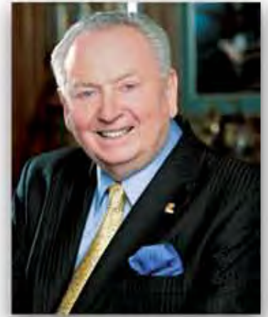
Rex Maughan az igazgatóság elnöke, vezérigazgató

Hiszem, hogy valahol legmélyen mindenkiben ott rejtőzik a kalandor. Néhányan közülünk kockázatvállalóak, néhányan a világ végére utaznának, mások ezek előtt szeretnének nyilvánosan beszélni, a legtöbben pedig arról álmodunk, hogy felfedezzük az ismeretlent. Valahol mindannyiunkban megtalálható a kalandor, valószínűleg ezért kötöttünk ki a Forevernél. Bármilyen is az okod, megkérlek, hogy azt gondold újra, és értékeld újra a miértet. Egy újabb év küszöbén állunk. Egy új évet, egy üres lapot kezdünk. 2015-ben az a feladatod, hogy megtaláld a saját kalandodat. Szánj egy kis időt és tekint vissza a 2014-es évre! Mit voltál képes megvalósítani? Hogyan? Mit fogsz elérni ebben az évben? Az egyik legcsodálatosabb lehetőség a Forevernél, hogy képes vagy magad alakítani a saját sorsodat. A sikered az erőfeszítésedben, és a magad, valamint az üzlet iránti elkötelezettségedben mérhető. Mint bármilyen más kalandnál, itt is többféle lehetőség kínálkozik, és van pár fontos lépés, amit meg kell tenned azért, hogy elérd a céljaidat.