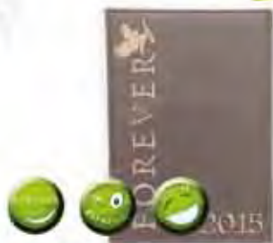
Sonya skin care packet