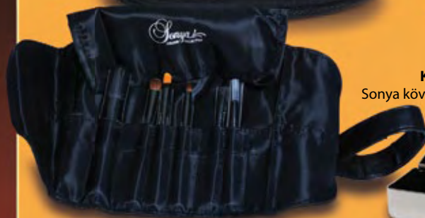
KI 138 Mini 6 db-os ecsetkészlet rollban