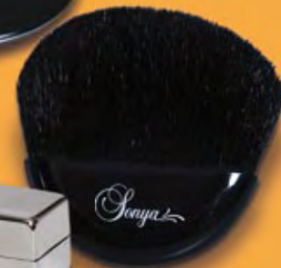
KI 139 Sonya félhold alakú pirositó ecset