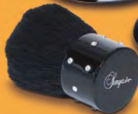
KI 114 Sonya köves kabuki ecset