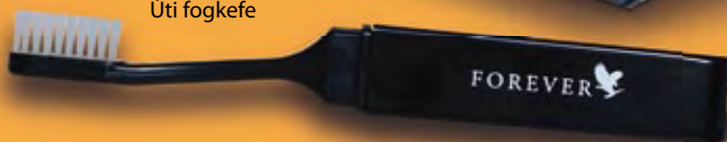
KI 135 Úti fogkefe