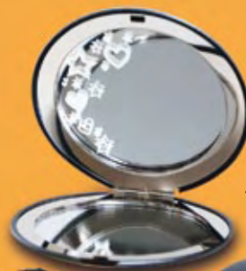
KI 115 Tükör -szívek és csillagok