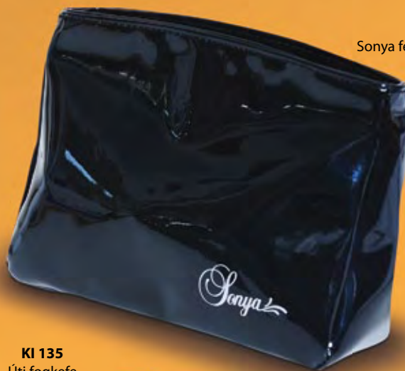
KI 111 Sonya fekete kozmetikai táska