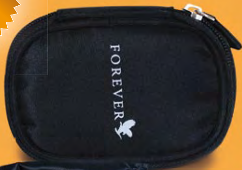
KI 134 Manikűrkészlet