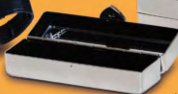
KI 130 Kövekkel díszített rúzszeneca