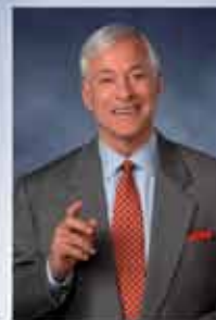
BRIAN TRACY pisac, trener i savjetnik