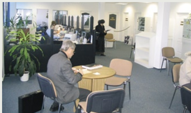
Ured u Debrecenu