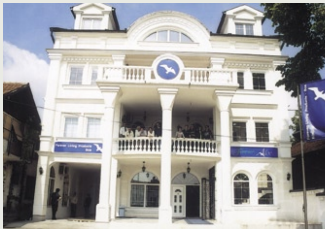
Ured u Bijeljini

Bijeljina: +387-55-211-784. Radno vrijeme: 9:00–16:30 sati.