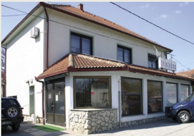
Ured u Lendavi

Obavještavamo Vas da je u tržinskom skladištu radno vrijeme ureda ponedjeljkom i četvrtkom od 12:00 do 20:00 sati, a utorkom, srijedom i petkom od 09:00 – 17:00. Ovo radno vrijeme vrijedi i za telefonske narudžbe. Broj telecentra (telefonske narudžbe): 01/ 563 – 7501