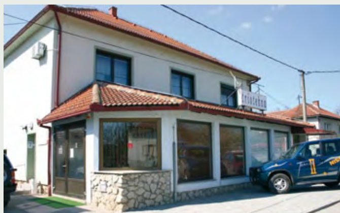
Ured u Lendavi