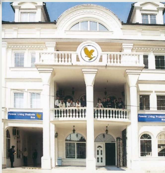
Ured u Bijeljini