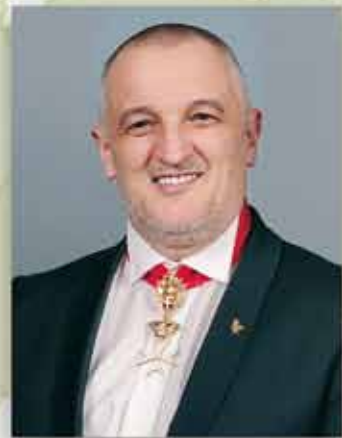
dr. Sándor Miliesz državni direktor

P rije 166 godina mladež Europe uzela je u ruke oružje kako bi izborila slobodu: Austrijanci, Mađari, Slaveni prolijevali su svoju krv za bolju budućnost. Čast i zahvalnost im za junačka djela! Cilj je i danas aktualan, jer se tijekom proteklih stoljeća mnogome promijenilo shvaćanje slobode. Danas je prvenstveni cilj osobna financijska neovisnost i uz nju pripadajuća djelatnost po izboru. Čak se i sredstvo borbe u znatnoj mjeri promijenilo. Pouzdanost, ljubav i međusobno pomaganje preuzeli su ulogu oružja.