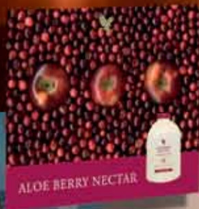
Poster 10 kom./paket, u papirnatoj futroli (50x60 cm)