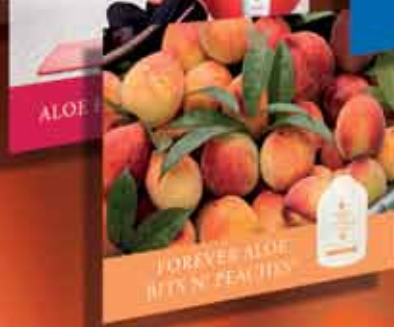
Mini kalendar 2012. 10 kom./paket, u 5 verzija