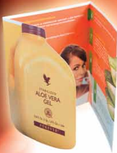
Aloe – brošura Korisne informacije o Aloe Vera Gelu