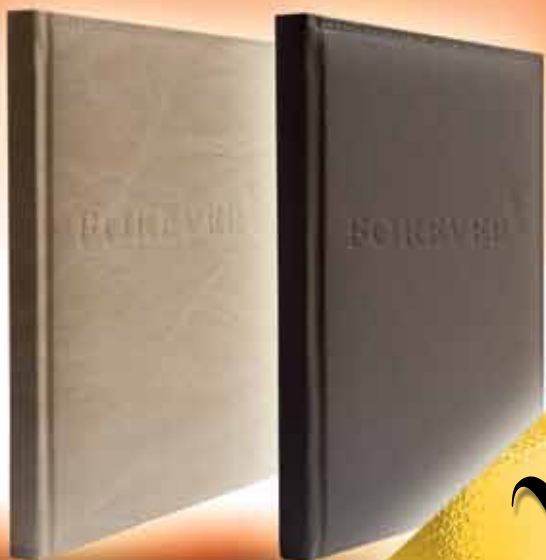
Agenda 2012. S korisnim informacijama o Foreveru i proizvodima